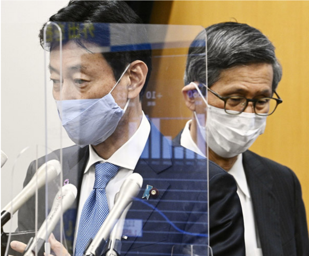
ほんとに、情けない…