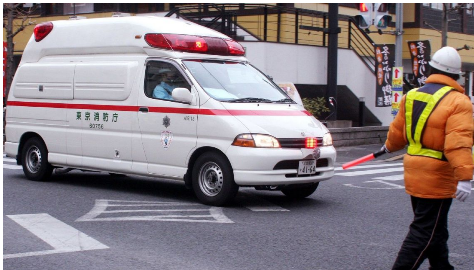
救急車が駆けつけても受け入れ先が見つからず、見殺しにされる最悪ケースも生じている

新型コロナウイルスの感染拡大が続く中、東京都での自宅療養を余儀なくされている感染者数は、入院調整中を含めて約2万5000人を超える。容態が急変して、亡くなる悲劇も相次いでいる。