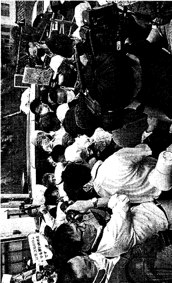
整行前の西町長(中央奥)の車を取り囲む町民(18日、上関町)

吹田愧の娘婿が持ってきた? という見出しが、この新聞の目玉の一つである。吹田愧は、山口県上関町の元町長であり、その娘婿である西村康徳が、山口県議会議員として活動している。この見出しは、吹田愧の娘婿が、吹田愧の政治的遺産を継承しているという点に焦点を当てている。