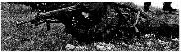
日米離島専選訓練