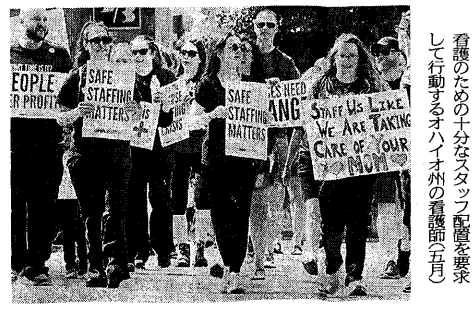
アメリカで看護師が人員増要求を主張する様子。看護師は、呼吸器感染症拡大で、小児病院がパンクしている。呼吸器感染症拡大で、小児病院がパンクしている。