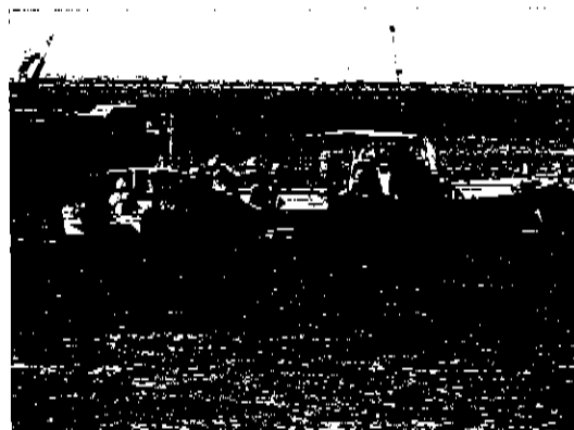
▲漁民の権利を無視したボーリング調査に反論する