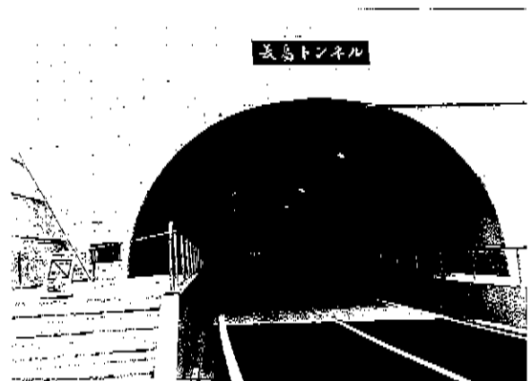
▲ 写真 2018,11,18・長島トンネル開通

原発予定地の四代へ行く県道を町道へ変更して、中国電力の発注により町道拡幅工事が急ピッチで行われています。